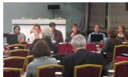
Drynet members during Side Event on "Pastoralism in Dryland Areas"

деле преодоления деградации земель». Кроме того, они представили новые публикации для практического использования и для обсуждения. Это такие публикации, как «Роль организаций гражданского общества в управлении засушливыми землями – Практическое руководство для планирования, классификации и анализа уровня общественного и политического участия», изданная совместно проектами «Драйнет» и «Глобальный Механизм», а также меморандум «Драйнет» «Бурный рост производства биотоплива и его последствия для засушливых земель». Все эти публикации теперь доступны на нашем сайте. Хотя организации, представляющие гражданское общество, имеют возможность открыто участвовать в таких мероприятиях, вопрос заключается в том, какое конкретное влияние они могут оказывать на процессы принятия решений. Данный бюллетень предлагает вниманию читателей некоторые точки зрения, существующие по этому вопросу, и пытается прояснить,