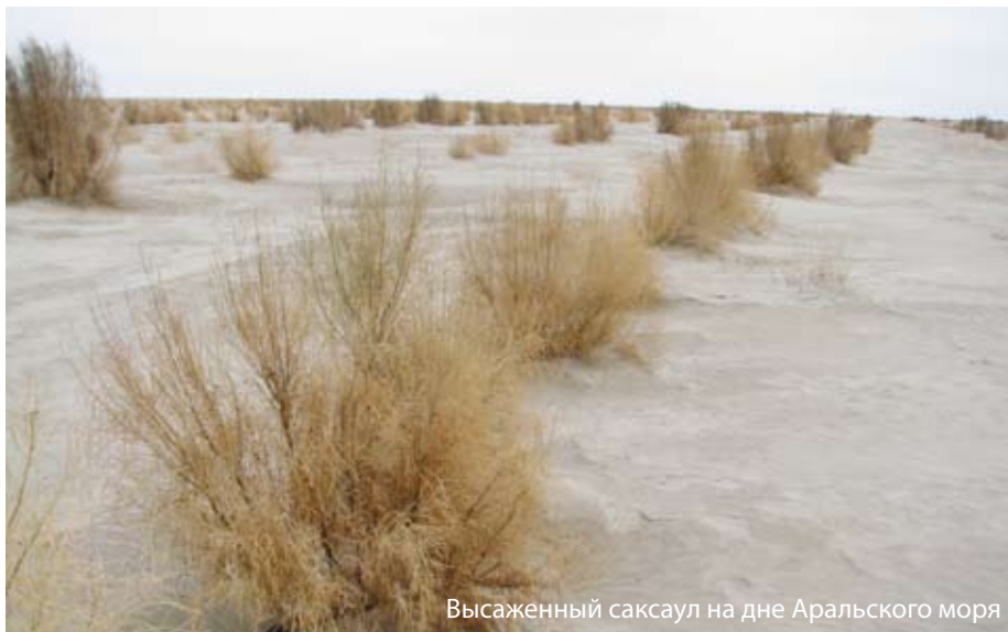
Высаженный саксаул на дне Аральского моря

В середине прошлого века площадь Арала с островами составляла 64,5 тысячи квадратных километров. Водоем по объему был четвертым в мире, за что и назван Аральским морем. Теперь оно переместилось в третью десятку и разделилось на три акватории. Площадь осушенного дна приближается к пяти миллионам гектаров. Ежегодно отсюда выносятся более ста миллионов тонн соли, пыли и песка, усиливая опустынивание и деградацию земель в Приаралье. Лесомелиорация позволяет в значительной степени смягчить этот процесс.