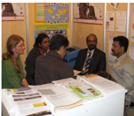
Visit of the Indian Focal Point to the Drynet info stand at the CRIC7.