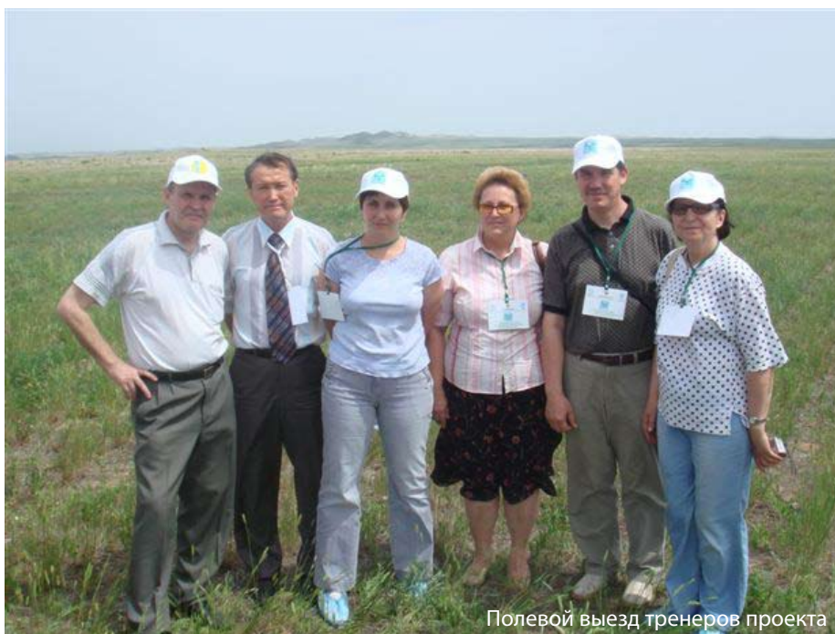
Полевой выезд тренеров проекта

Цель проводимых мероприятий – восстановление экологического потенциала деградированных пастбищ за счет обеспечения оптимальных нагрузок выпаса и обеспечение скота качественными кормами. Выбор местных общин проводился в различных природно-климатических зонах и областях Казахстана: Акмолинская, Карагандинская (засушливая зона), Алматинская (пустынь)