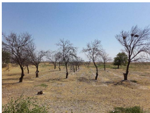
Фото: Бурение скважины и погибающие сады в Зафарабадском районе Согдийской области