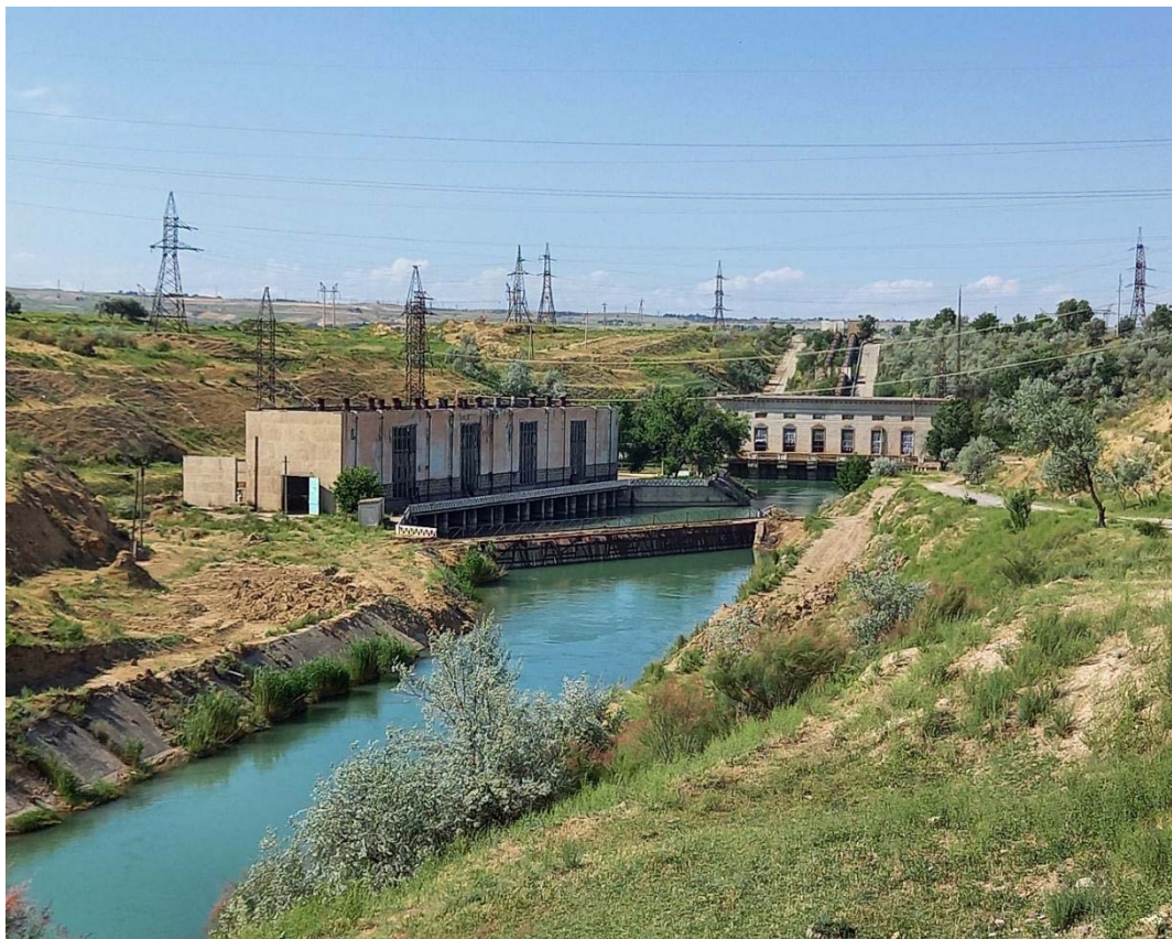
Фото: Голодностепская насосная станция – 1 (ГНС-1) в Зафарабадском районе Согдийской области

В Таджикистане более 90% площади страны занимают горы, высота которых достигает 7 000 метров и выше. При этом часть страны располагается на высоте более 3 000 метров над уровнем моря, и такой горный ландшафт создает необходимость в подъеме воды из рек и каналов для орошения земель. В связи с этим более 50% орошаемых земель Таджикистана расположены в зонах машинного орошения, для чего в стране построены крупные насосные станции.