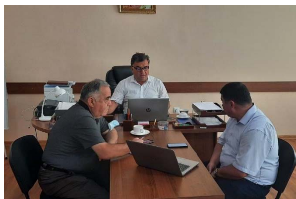
Фото: Национальные эксперты изучают показатели 173 счетчиков в Согдийской Области Таджикистана

В проекте также участвует международная компания по производству насосов “Grundfos”, которая делится с национальными экспертами международным опытом по повышению энергоэффективности.