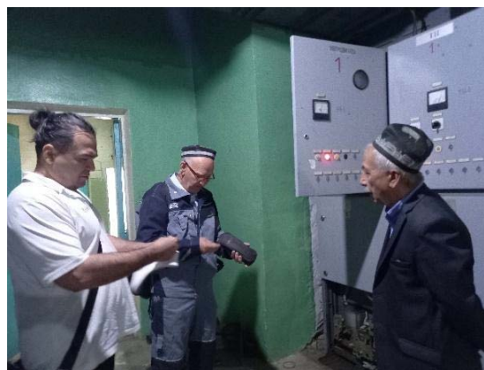
Фото: Замеры расхода воды и электроэнергии на насосной станции ГНС-1 при поддержке Grundfos