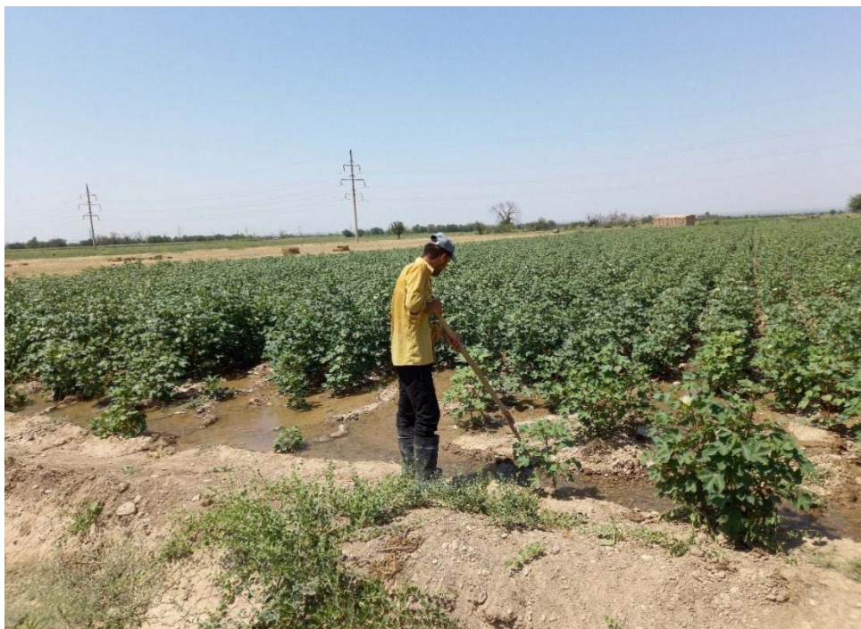
Фото: местные фермеры орошают поля в Зафарабадском районе Согдийской области

2030 году население республики может составить 11,2 млн. чел. Для поддержания уровня 0,08 га орошаемых земель на душу населения, необходимо ежегодно осваивать земли на площади не менее 15 тыс. га., и очевидно, в зонах машинного орошения.