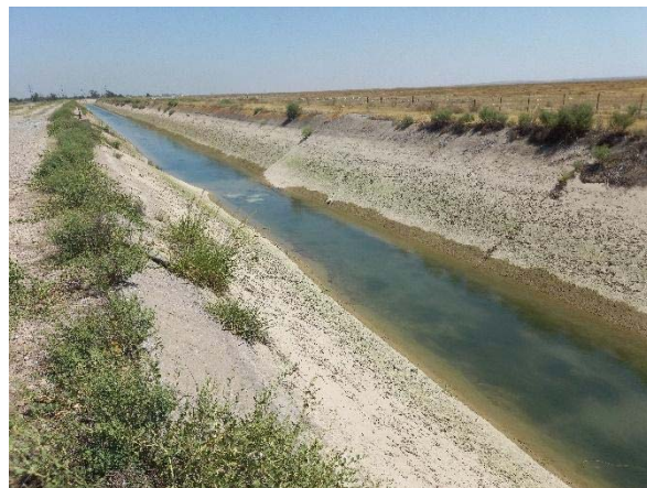
Фото: Канал ТМ-2 в Зафарабадском районе, начало канала слева и нехватка воды в среднем течении с права.

Из-за нехватки воды по каналам ТМ-1, ТМ-2 и ТМ-4 фермеры вынуждены бурить скважины для орошения своих земель. Стоимость бурения скважин составляет от 20 000 до 25 000 долларов США. Однако бурение осуществляется без предварительных геологических изысканий, в результате чего после бурения скважин и произведенных затрат определенные фермеры остаются без воды, так как не могут попасть в артерию водоносного горизонта. Но некоторые фермеры все же добиваются успехов в этой деятельности, что ведет к возникновению неконтролируемого изъятия подземных вод и снижению уровня водоносного горизонта, способствуя деградации земель в Зафарабадском районе, а также высыханию садов и прочих сельскохозяйственных культур.