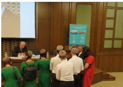
К Международному Дню птиц – награждения учащихся школы №55 Ашхабада за участие в конкурсе «Что такое ВБУ и кто такие ВДП»? Ашхабад, Национальный музей Туркменистана, 30 марта 2018 г.