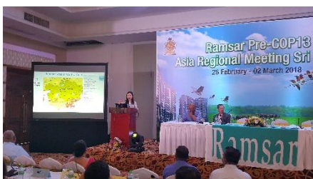
Презентация РРИ-ЦА, включая Туркменистан, на Asia Pre-COP 13 Ramsar. 26 февраля 2018 г., Чилау, Шри-Ланка.