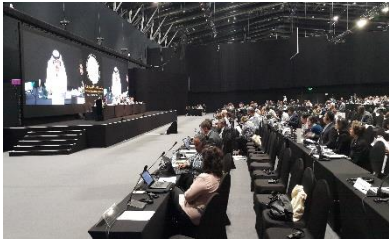
Международное продвижение РПИ-ЦА на конференции сторон: COP-13 Ramsar Convention. 21-28 октября 2018 г., Дубай, ОАЕ.