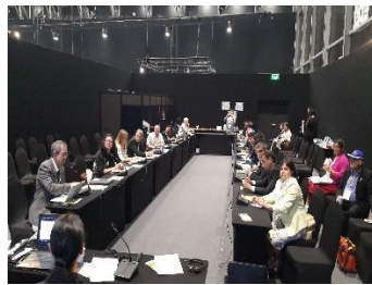
Презентация и side-event РПИ-ЦА на конференции сторон COP-13 Ramsar Convention. 23 октября 2018 г., Дубай, ОАЕ. (совместно с представителями Казахстана, Кыргызстана, Таджикистана, Туркменистана и Узбекистана).