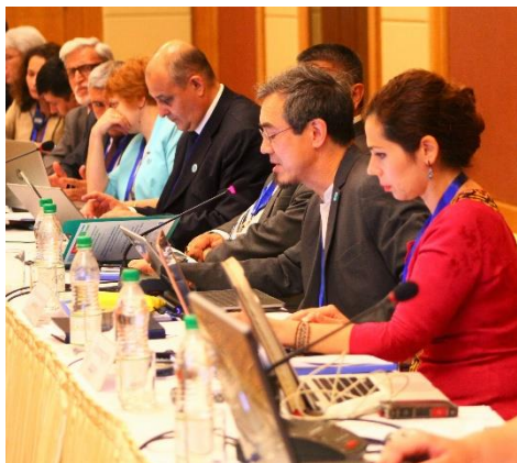
Заседание МКУР МФСА: Старший Региональный Советник Секретариата Рамсарской конвенции по Азии и Океании – Лью Янг сообщает об организации Рамсарской Региональной Инициативы Центральной Азии (РРИ-ЦА). Ашхабад, 25 мая 2016 г.

24-26 мая 2016 г. – в Ашхабаде, на Заседании МКУР МФСА впервые было объявлено об организации Рамсарской Региональной Инициативы Центральной Азии (РРИ-ЦА).