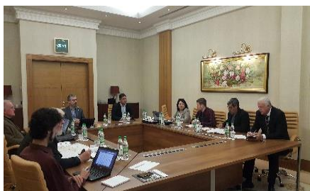
Встреча МСОП/ООПТ по проблеме Номинаций и управления территориями Всемирного природного наследия в Центральной Азии. 13 октября 2018 г., Ашхабад.

В отношении сотрудничества с НПО: 13 октября 2018 г. в Ашхабаде (состоялась расширенная встреча руководителей Центрального совета Общества охраны природы Туркменистана (ЦС-ООПТ) и Департамента IUCN/MCOП по Восточной Европе и Центральной Азии (IUCN-ЕЕСА), посвящённой проблемам номинации и управления территориями Всемирного природного наследия в Центральной Азии. Представитель КК РРИ-ЦА внёс предложение о необходимости рассмотрения планируемой ООПТ Таллымерджен на крайнем востоке Туркменистана в одной системе с территорией ВБУ Келиф-Зейит как потенциальной Рамсарской. Это получило развитие в рамках выполнения в 2020-2021 гг. проекта WWF «Мониторинг и сохранение уязвимых видов птиц на приоритетной территории Таллымерджен – Келиф-Зейит, ключевом участке Евразийско-Африканского пролётного пути».